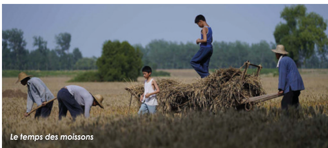
Le temps des moissons