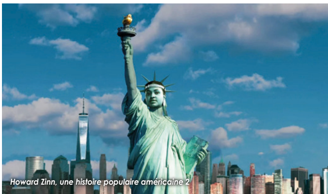
Howard Zinn, une histoire populaire américaine 2