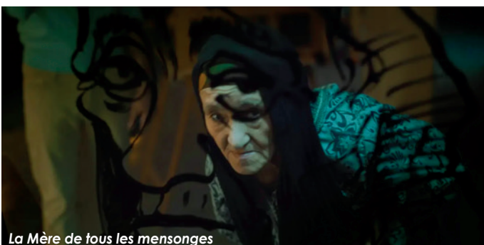
La Mère de tous les mensonges