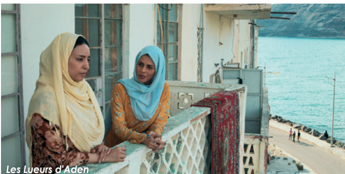
Les Lueurs d'Aden